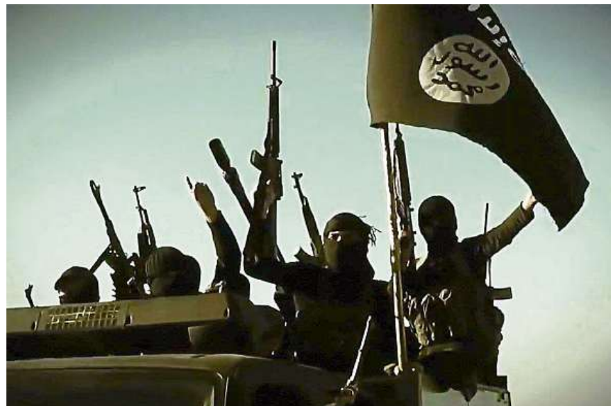
Unterstützung des IS. Viele der beim Verurteilten sichergestellten Filme waren mit der schwarzen Flagge des Islamischen Staates gekennzeichnet.

geworden, der nach Irak oder Syrien ausgereist war. Zudem hatte die Bundesanwaltschaft letztes Jahr Ermittlungen gegen einen Arlesheimer Konvertiten aufgenommen, welcher der Salafistenszene nahestand und mit Phosphor hantiert haben soll. Neue Fälle sind seither im Baselbiet nicht bekannt geworden. In Verdachtsfällen dürften aber ohnehin die Bundesstellen aktiv werden, wie die Sicherheitsdirektion bestätigt.