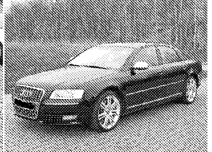
Gewaltsames Carjacking: Ein Maserati Granturismo und ein Audi S8 (Symbolbilder) wurden geraubt.